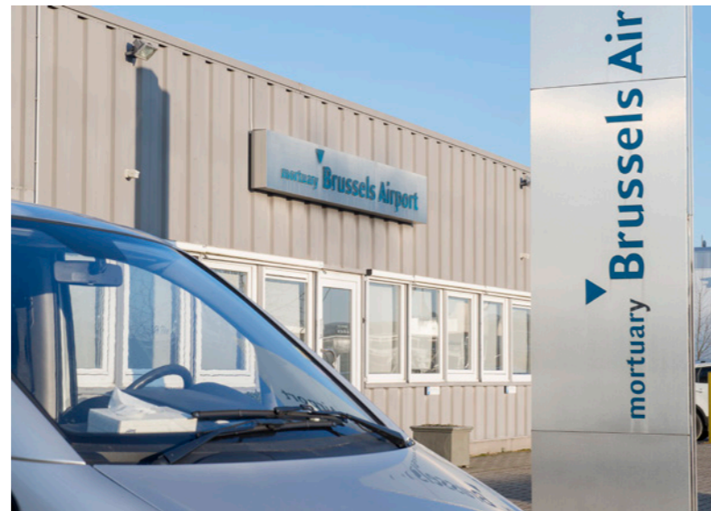
Uitvaartunie Vlaanderen biedt partners de kans om zich voor te stellen via een publireportage. De partners zijn verantwoordelijk voor de inhoud.

In de wereld van uitvaart staat DELA Repatriations als een betrouwbare steunpilaar wanneer er overledenen moeten gerepatriëerd worden naar België of wanneer overledenen naar hun land van herkomst moeten vervoerd worden. In een steeds kleiner wordende wereld waarbij mensen emigreren naar het buitenland of langere periodes in het buitenland verblijven en in diezelfde wereld waar steeds meer buitenlanders proberen een nieuwe leven op te bouwen in ons land, komt het natuurlijk vaker voor dat een overledene moet overgebracht worden naar België of overgebracht worden naar zijn land van herkomst. Op die manier kan de overledene bij zijn familie zijn laatste rustplaats vinden volgens zijn of haar religie en/of cultuur. Als uitvaartondernemer is het natuurlijk niet eenvoudig om alle reglementering te kennen die met deze materie te maken heeft.