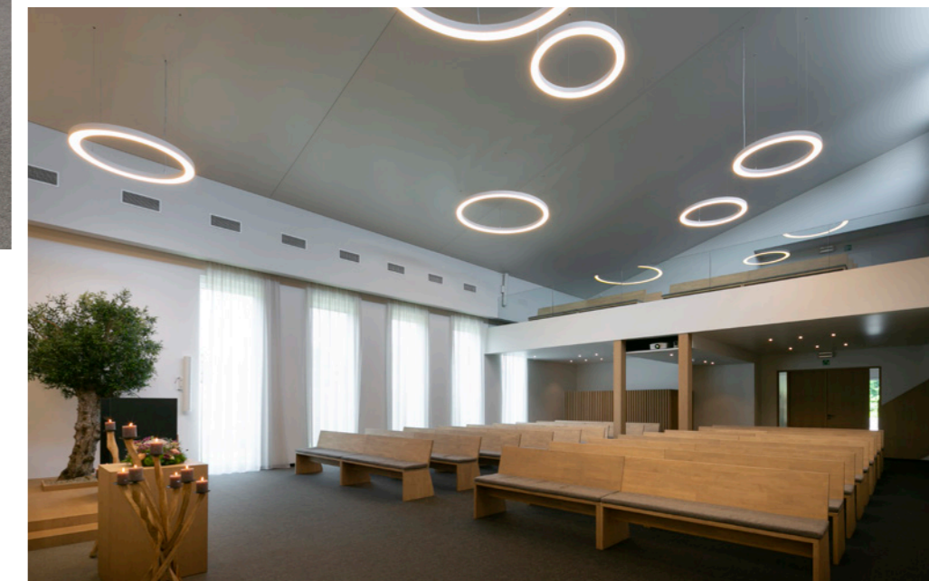
De sfeervolle aula van Uitvaartzorg Demuys