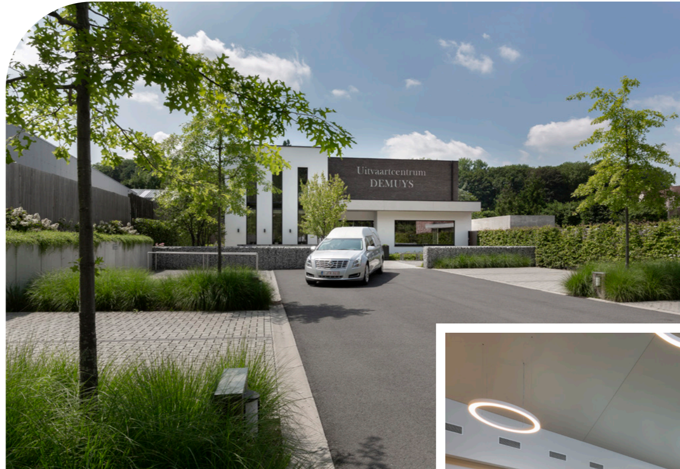
Zicht op het uitvaartcentrum in Poperinge